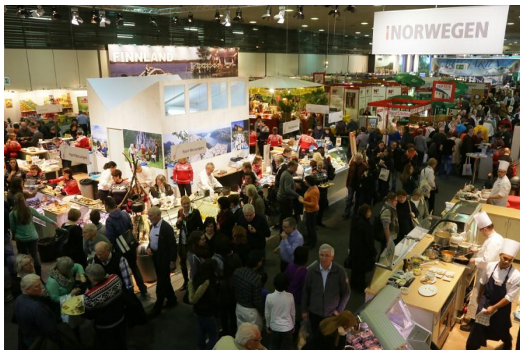
Alltid mye folk på den norske paviljongen på Grüne Woche

På 300 kvm vil vi få se norsk mat og kultur presentert på sitt beste i utlandet. Vi får omvisning på standen med smaksprøver og presentasjon. I år er det utstillere fra Trøndelag, Fjell-Norge og Fjord-Norge som deltar på standen. Etter omvisningen serveres en nydelig 3 retters lunsj satt sammen av produkter fra de ulike utstillerne.