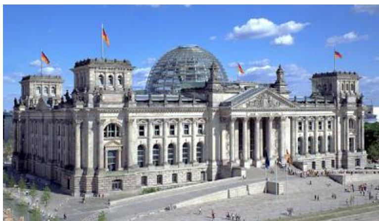
Riksdagsbygningen i Berlin

En av hovedattraksjonene i Berlin er Riksdagsbygningen med sin enorme glasskuppel.