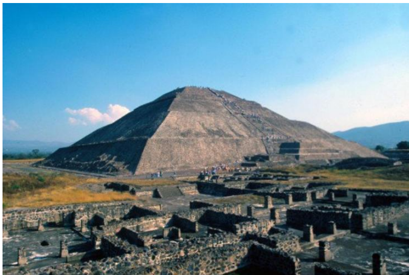
Solpyramiden i Teotihuacan

På ettermiddagen går ferden til tempelruinene i Teotihuacàn , et av Latin-Amerikas største ruinkomplekser. Muligheter til å studere og bestige de mange praktfulle templene og pyramidene som er datert til rundt 200 år før vår tidsregning. Vi kan nevne Sol- og Månepyramidene, sommerfugltemplet, La Calzada de los Muertos ("de dødes aveny") og Quetzalcoatl-templet. Teotihuacàn hadde sin storhetstid mellom år 450 – 650 og var på den tiden muligens verdens største by.